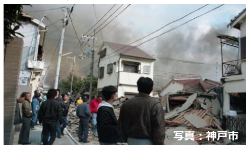
1995年の阪神・淡路大震災の写真