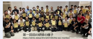
第一回目の研修の様子 https://dmtc.tokyo/2023/07/04/the-ec-monitor/