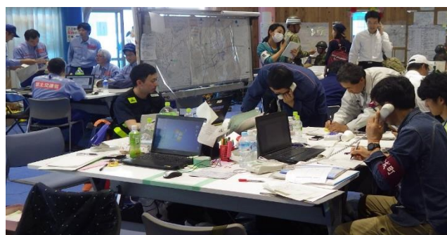
災害対策本部訓練のイメージ