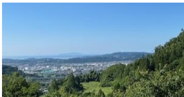
秦野市を事例に自然環境特性を学ぶ