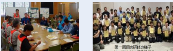
第一回目の研修の様子 https://tdmtc.tokyo/2023/07/04/the-ecm-monitor/

行政、企業、地域などすべての組織にEOC(災害対策本部)機能は必要にもかかわらず未体験のまま被災する現状を打破する。